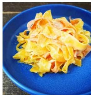
人参とツナのサラダ