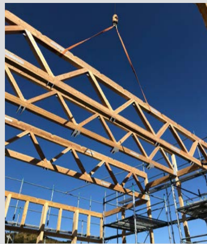
遊戯室の屋根を支える木トラスを架けている。長さ6間(約11m)の木トラスはスギ材で大工の工場で作られた。同じスギ材でも使い次第で強度の高い構造をつくる事が出来る。

参加された方は、餅まきの前後に建築中の建物を覗いたり、お母さん同士やご近所方と話をしたりと、短い時間でしたが楽しんでいただけたようです。こんな交流イベントが出来るのも木造の建物ならではの楽しみではないでしょうか。木造建築は建築中でも人と人をつなげ、たくさんの和を生んでくれました。