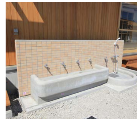
子供たちは水遊びが大好き、園庭には3か所の水場があり、水遊びや泥んこになった体を洗っている。