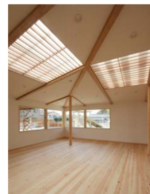
園庭がよく見えるホール。遊戯室の観客席になったりランチルームになったり。