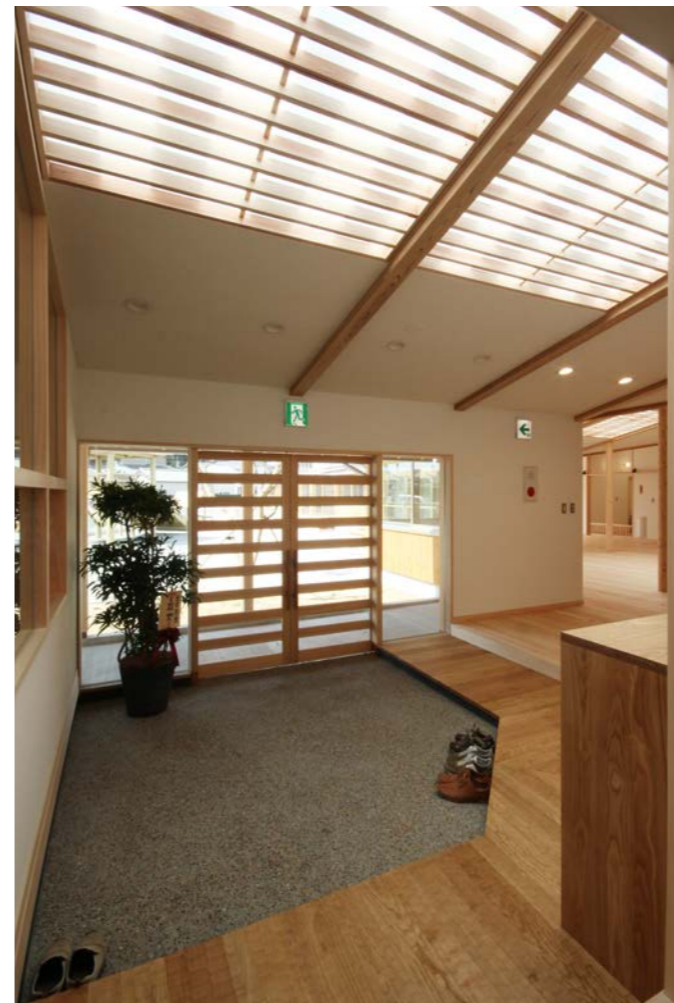
玄関内部の様子。障子付きの天窓が明るく、L型の式台は子供たちが一度にたくさん出入りするために考えた。出入口はガラスとし、内部から園庭がよく見える玄関とした。