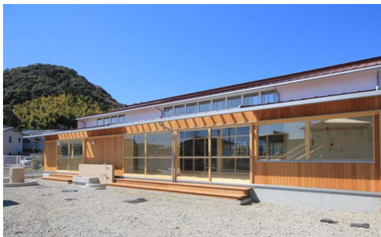
2P) 幅3.6m、長さ30mの縁側テラス。明るく温かいこの場所はみんなのお気に入り。ご飯を食べたり遊んだり、天気に関係なく使えて便利な空間。