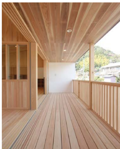
全保育室の北側に設けたウッドデッキ。直接外には出れないが、北側にあるため、夏は涼しく気持ちの良い場所。屋根付きで雨もしのげるので、いろいろな場面で使えて便利。