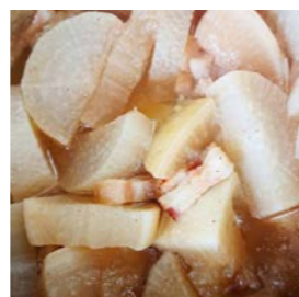
大根とベーコンの煮物