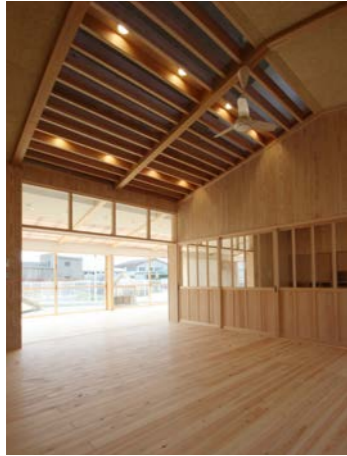
右) 2歳児室と3歳児室をつないだ保育室。内容によって個別、合同の保育が行え、保育士の目も届きやすい。縁側テラスやデッキを使ってぐるっと回れて遊びも広がる。