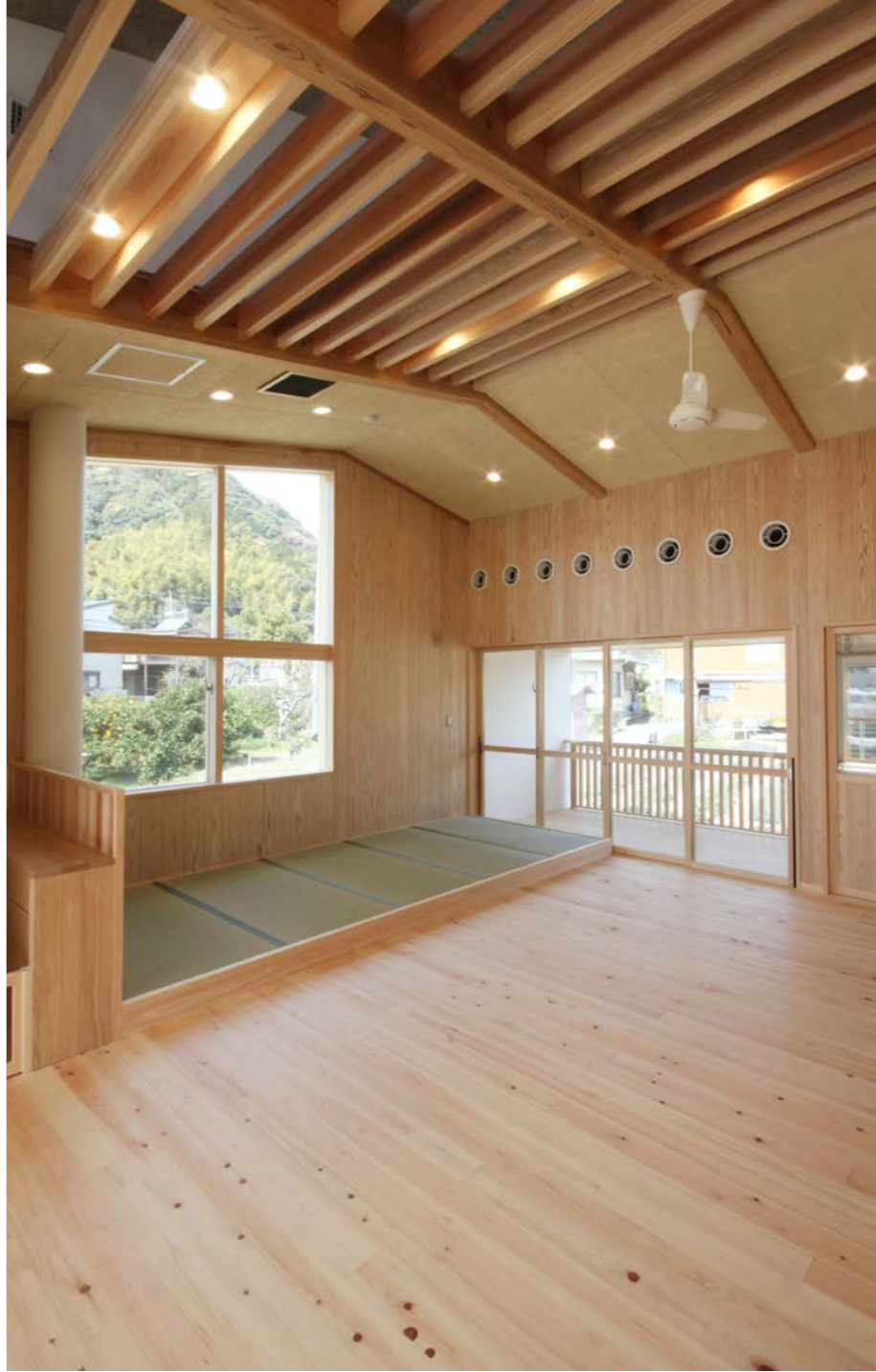
敷地の一番落ち着く場所につくられた0歳児室。床と畳スペースが混在し、遊びやお昼寝に合わせて利用している。部屋には調乳コーナーが設けられ、浴室、トイレとも続いている。