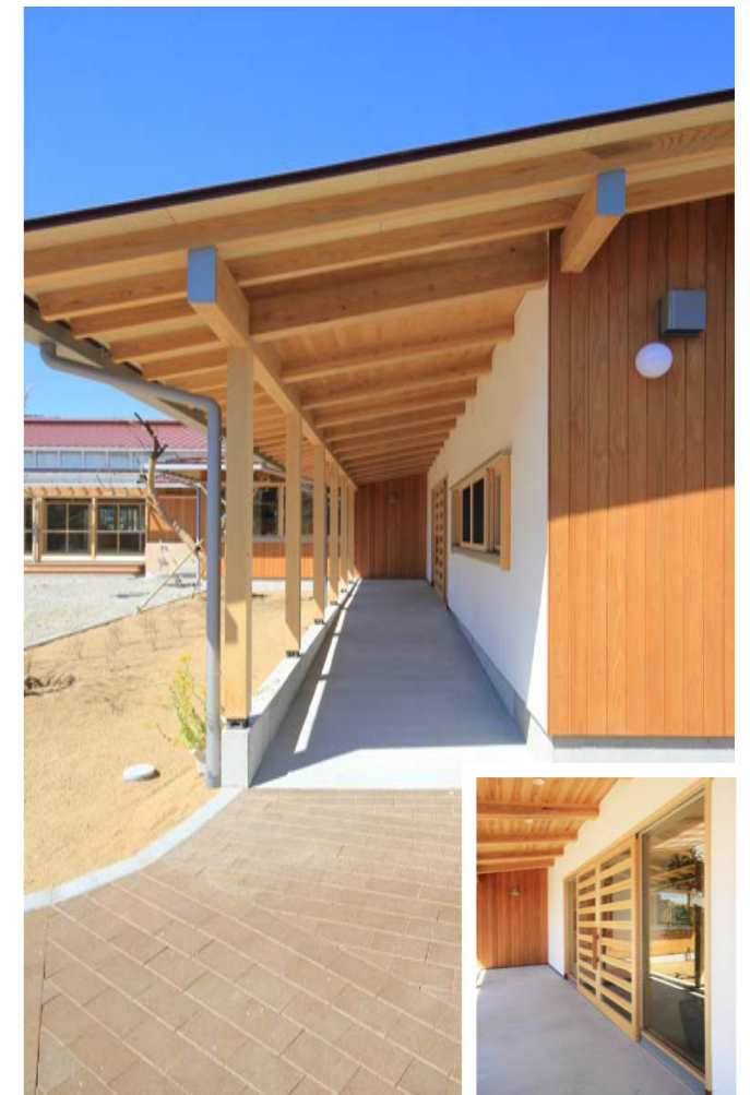
屋根付きスロープのエントランスアプローチ。深い軒に守られ、雨の日の通園に便利。玄関と事務所窓は園庭向きにつくられ、保育者の目が届きやすいプランになっている。