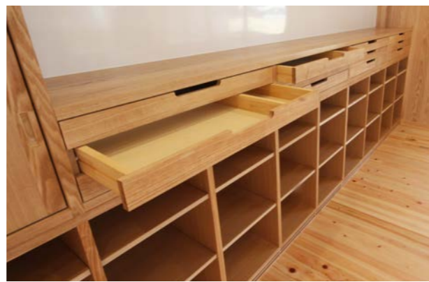
ロッカーと絵の引き出しを組み合わせた間仕切り収納。保育士さんからの希望をまとめ、サイズや使い勝手を考えて作成した。上部にはホーローのホワイトボードを取り付けた。