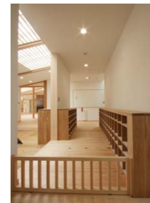
玄関裏の靴箱、高さを変えて長靴が入るように工夫。