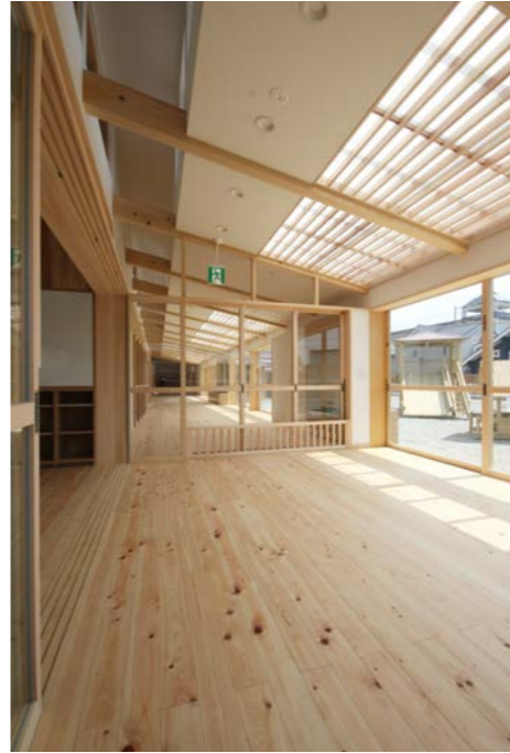
0歳児室専用の縁側テラス。ガラス戸で空間を区切り、明るく暖かな場所に加えて落ち着きのある空間とした。天井の天窓には遮熱のための障子を取り付けた。