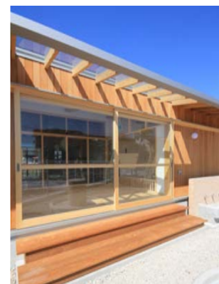
緑側テラスから園庭へ出入りするための踏み台。室内に光が入るようにと設けたガラス屋根。