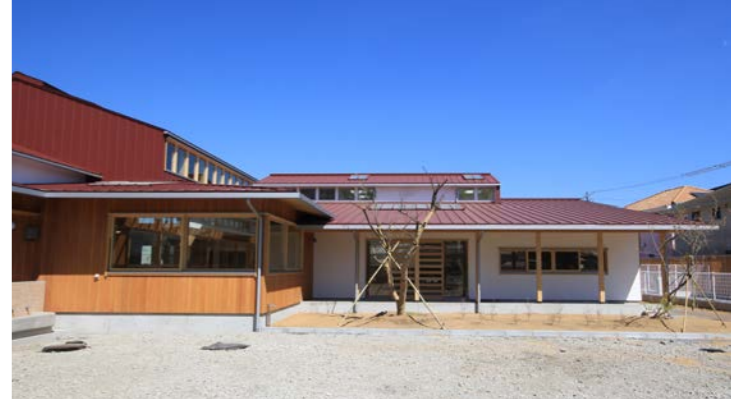
園庭からホール、事務所棟を見る。排煙窓や採光窓が外観のポイントをついている。外壁は木と漆喰。

乳児から幼児、大人も利用する保育園は、様々な寸法や工夫で来ています。扉や家具など、既製品は色々ありますが、大きさや高さ、収納などを工夫して職人さんにつくってもらいました。