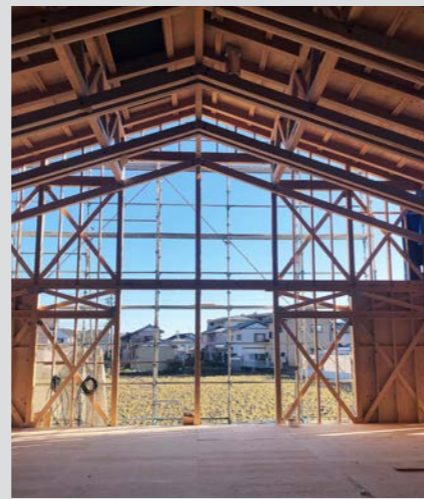
構造体がそのまま現れた骨組みの遊戯室。出来上がると見えなくなってしまう部分だが、建物を支える重要な要素が詰まっている。