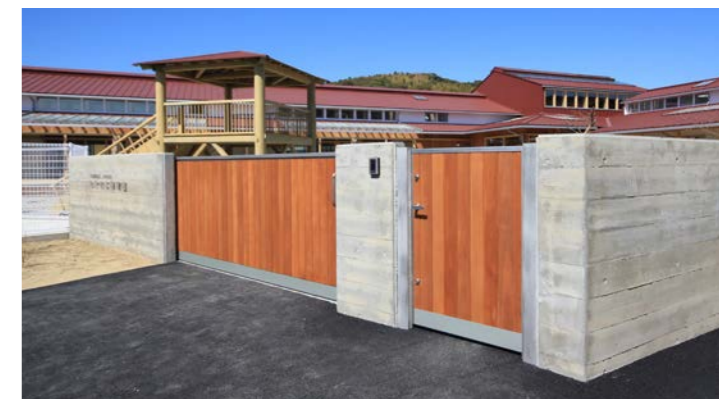
杉型枠でつくられた塀と杉板でつくられた門扉。大きな扉は園庭から出入りできる車両用出入口。