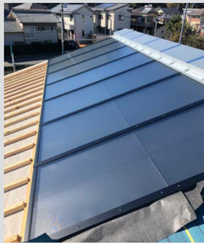
0歳児室と遊戯室の屋根の上に載せられた太陽熱集熱パネル。OMソーラーと呼ばれる床暖房システムが採用されている。