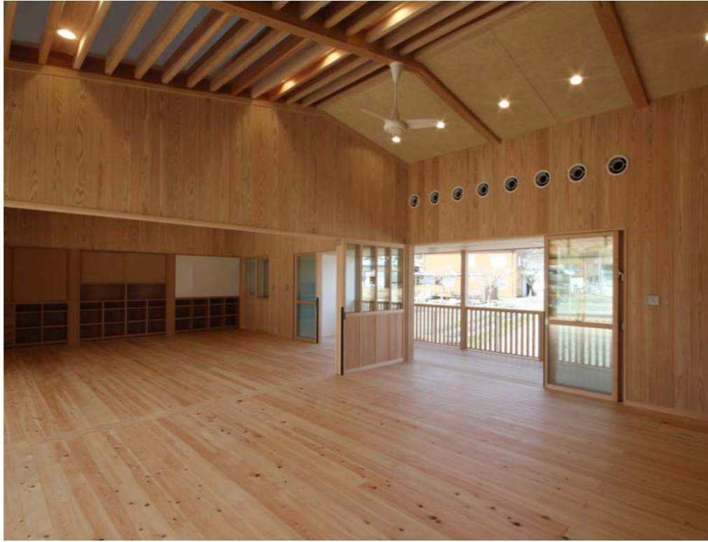
左) 保育室天井には格子が組まれ、天井裏に設けた窓によって光や風が通る仕組みとなっている。