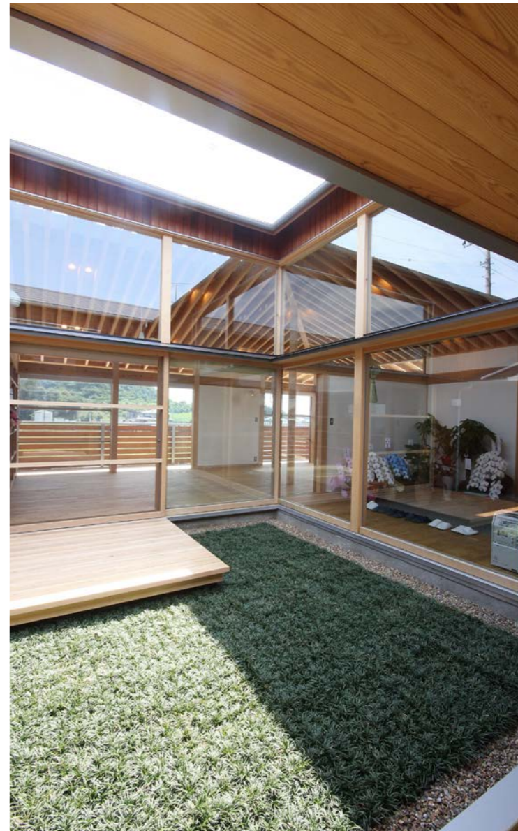
中庭に面して広間と玄関に大きなガラスが配置されている。時間の変化で日差しが変わり、明るくて暖かい室内が心地よい。グランドカバーのタマリユウの中に緑台のデッキをつくり、イベントや子供たちの遊び場として活躍している。