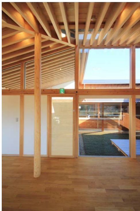
中庭に向けた大きなガラス窓が特徴の広間スペース。中庭を通して視線は交差するが、どこか守られた安心感のある空間。