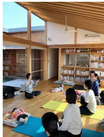
定期的に行われているピラティス教室。広いスペースを使ってゆったりと行われている。