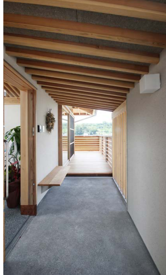
玄関ポーチに立つとデッキを通して視界が広がり、通り抜ける風が気持ちいい。デッキは思わず靴を脱いで上りがりたくなるような雰囲気。