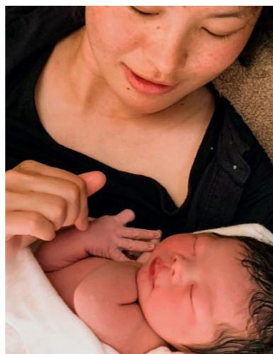
出産した直後の女性は菩薩様のような穏やかで優しい眼差し。お産の度に、ついみとれてしまう。