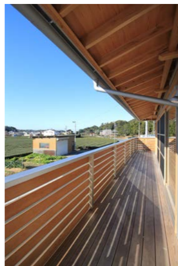
玄関ポーチから広間までつながった回廊式のデッキ。子供たちの絶好の遊び場で、競争したり追い掛けっこをしたりと楽しい場所になっている。