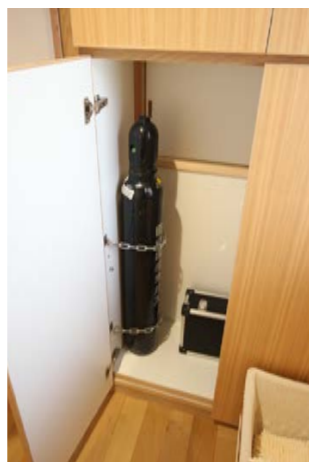
分娩室から使える酸素ボンベは反対側の脱衣室の収納の中に。いざというときに必要だが、見えていると不安を与えるので隠した。