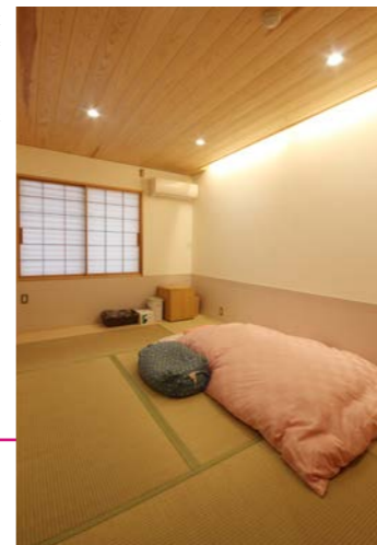
6畳+板の間の入所室には洗面と洋服収納、冷蔵庫も完備している。ママだけでなく、子供やパパも一緒に宿泊出来る広さを確保した。