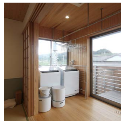
休憩室に隣接したサンルーム。出産やその後の宿泊の際はたくさんの洗い物が出ると聞き、日当たりの良い縁側に、洗濯機と物干しパイプを設置。