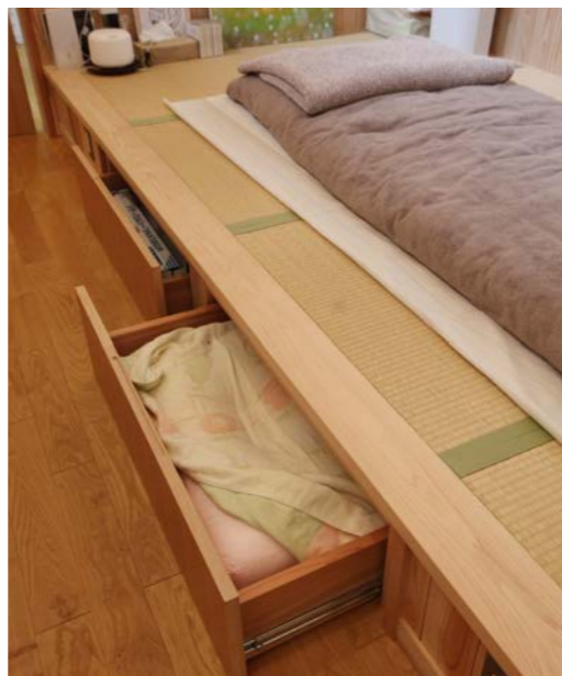
畳下のスペースを利用して引出し収納をつくった。使いやすく色々な備品が収納出来て便利な場所。