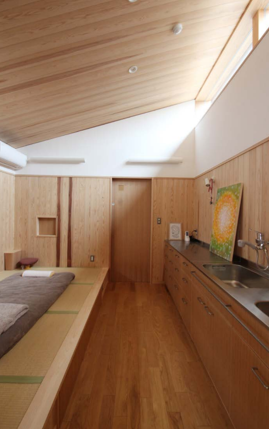
ハイサイド窓から光が差し込む分娩室。神秘的な生命の誕生をイメージして窓の大きさや高さなどを検討した。