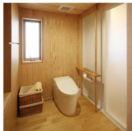
分娩室近くに設けたトイレと浴室。陣痛時に利用することもあると聞き、配置や動線を考えてプランした。手摺と柵も、ひと工夫。