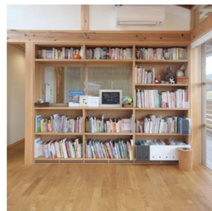
キッチンと広間の間に設けた絵本いっぱいの本棚。季節やイベントに合わせておすすめ本を飾ったり、ママに読んでもらいたい本などが紹介されている。

間取りや素材など、心地よい建築の要素は様々ですが、ちょっとした広がりや細部の工夫、面白い仕掛けなどで快適性や楽しさも変わってきます。利用者目線の気遣いや働きやすい工夫など、お茶畑助産院はアイデアの詰まった助産院です。