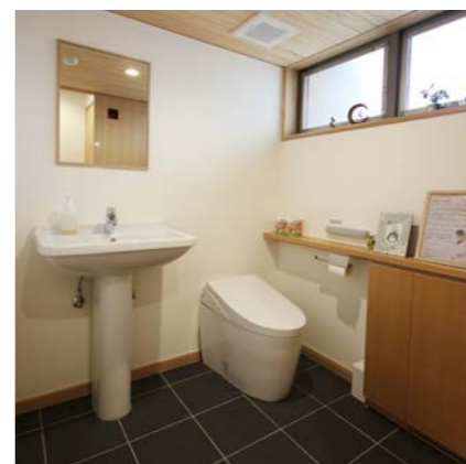
利用者みんなが使えるトイレ。広く綺麗な雰囲気トイレは、赤ちゃんと一緒に入ったり、ちょっとしたお化粧直しに使ったり。