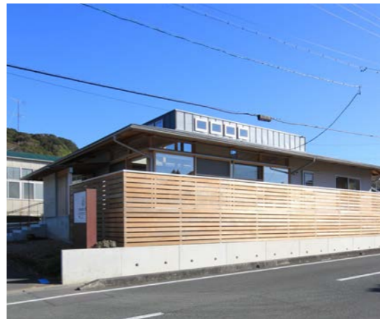
道路からの外観。自宅までの進入路は傾斜があり、建物の高さや基礎の設計に苦労した。板塀が程よく道路からの視線を隠し、室内は開放的で落ち着きがある。