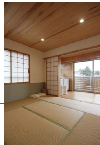
休憩室兼教室に使われている8畳の和室。今はマッサージや体操などが行われ、出産が重なった時は宿泊室としても利用予定。