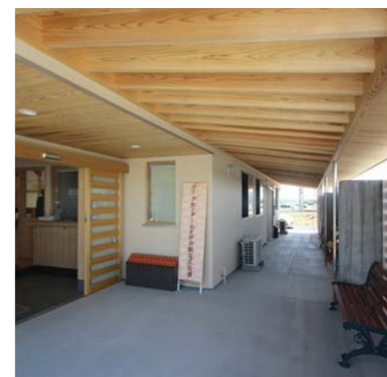
自転車置き場内部。雨と風を考慮して玄関脇に自転車置き場を作った。南から北にとても気持ちの良い風が吹抜け、夏場は休憩場所になりそう。