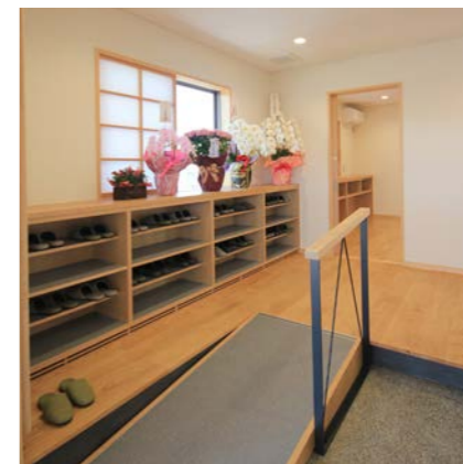
玄関に設けたスロープと下駄箱。スロープには手摺を設け、下駄箱には土足用と内履き用の棚を設けた。