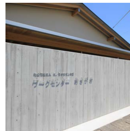
ステンレスで制作した表札。無機質な材料に凸凹をつけ、味わいのある仕上げとした。壁は杉板の型枠を使ったRC壁。