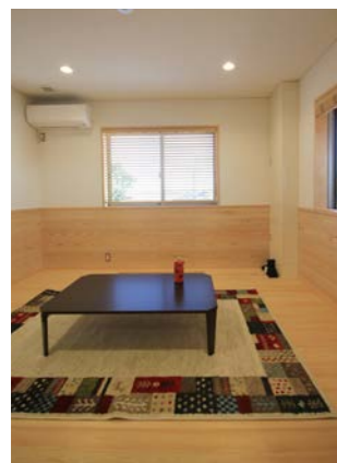
職員休憩室。休憩時間はゆっくり休んでほしいと思い、桧の床、杉の腰板で内装を仕上げた。桧の香りが清々しく、リフレッシュ出来るような休憩室になった。

玄関内部。玄関スペースは、様々な利用者や来訪者に合わせてスロープや手摺も設置した。床は少し贅沢に栗材の厚板を使っている。