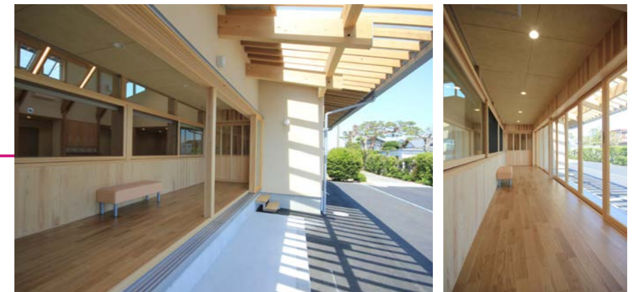
建物南面に設けた荷受室と作業車の駐車場。8枚のガラス戸を左右に引き込む事で大きな開口をつくった。日当たりがよく緑側のような空間になった。