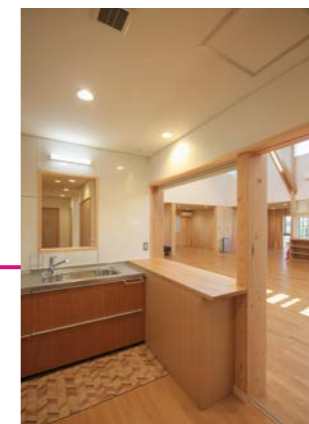
給湯室と作業室の間にカウンターを設置した。旧施設で昼食を一緒に食べたとき、お味噌汁を配っている姿を見てこの形を提案した。なかなか好評。