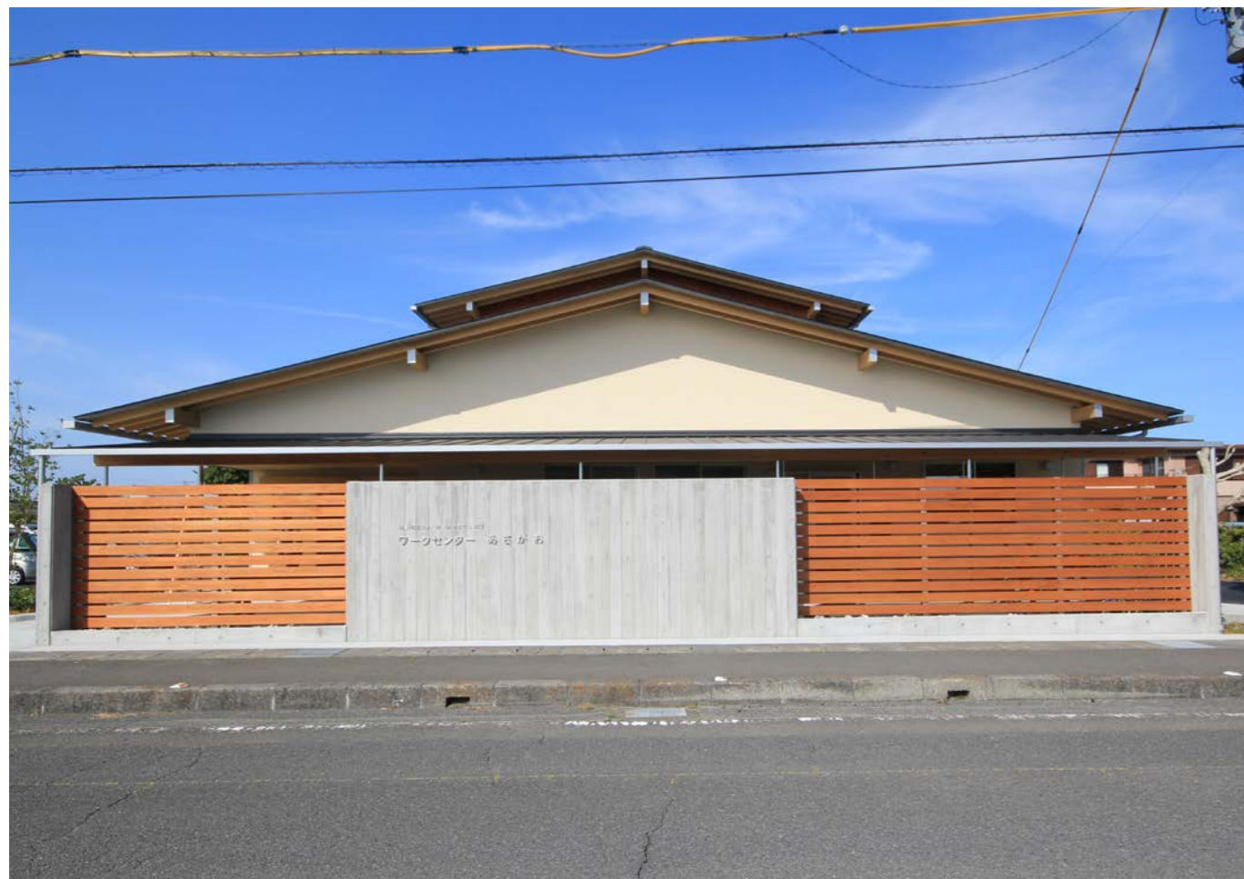
道路から建物正面を見る。シンプルでのびやかな切妻外観。この地域になじみ、たくさんの方が利用してくれる建物になってほしいと願っている。