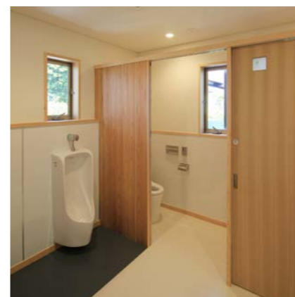
トイレ内部の間仕切りに杉のJパネルを利用した。ウレタン塗装で仕上げ、汚れが付きにくい工夫もしている。優しい色調のトイレになった。