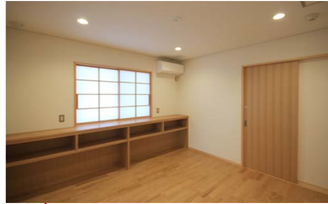
相談室内部。玄関からすぐに入れるように設けた。旧施設では狭かったが、様々な相談や打合せ場所に利用するために十分な広さを確保した。