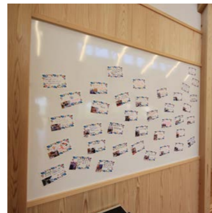
壁の一部に掲示板を作った。ホーロー板でつくられているのでホワイトボードとしても利用できる。

大きな建物は構造や空間設計に偏りがちですが、利用者や職員の目線に立って細部を考えていくことも大切な設計です。使いやすい大きさや高さ、また、細部のディテールなど、長く使われることを意識してつくり上げて行きました。