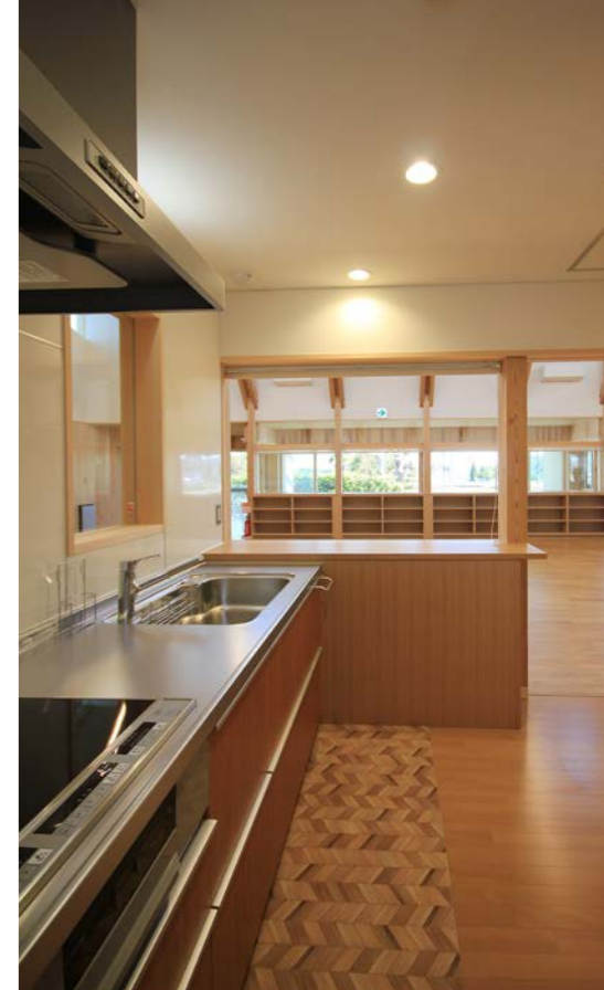
給湯室内部から作業室を眺める。お弁当やおやつなどを配りやすいようにカウンターを設けた。高さもちょうどよく、いろいろな場面で活躍しそう。