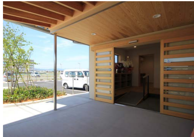
玄関ポーチと玄関建具。利用者だけでなく、地域の方や他の団体の方も交流できる施設とするため、玄関スペースを広めに確保した。玄関建具は桧で制作した自動引戸になっている。