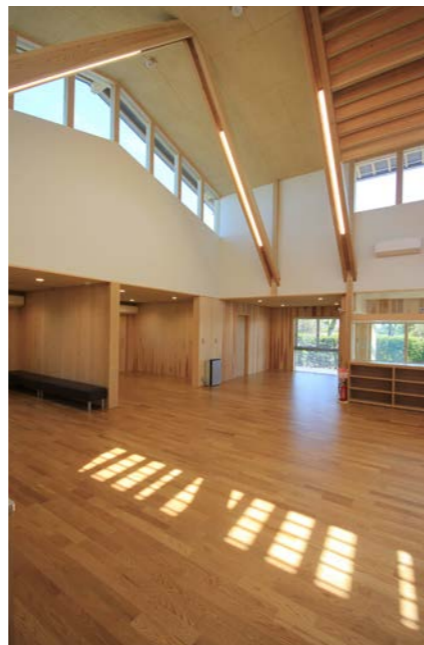
東西の妻面に設けたハイサイド窓からの間接光が作業室全体を明るくしてくれる。屋根の勾配に合わせて菱形形状のガラスを制作した。

挟み梁の間に設けたルーバーは、天窓の光を和のための反射板の役目をしている。木のルーバーを通った光は柔らかな印象になる。北面のハイサイドには排煙と排気を目的に開閉窓を設けた。ワンタッチオペレーター式で操作も簡単。