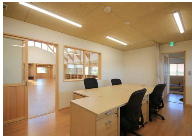
12帖の事務室。建物規模からみると小ぶりの事務室だが、旧施設より2倍程に広がった。室内から作業室が見え、利用者の仕事の様子を見守ることができる。