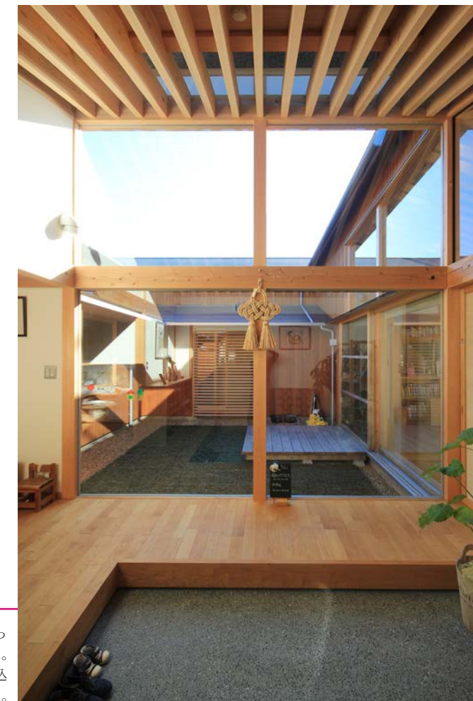
土間スペースを広く取り、ちょっとした接客も出来る玄関とした。中庭からの光がさんさんと入り込み、明るく気持ちの良いスペース。

景色もよく恵まれた敷地での設計ですが、助産院という用途からあえて中庭を囲んだ静かな雰囲気提案しました。中庭は光を集めたり、煙突効果で風道をつくってくれる優れた形状、たくさんの人が行き交う施設として、動線や視線も考えたプランです。